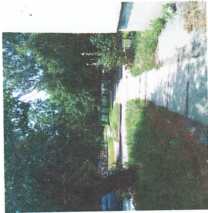
Подход к калитце с бульвара Энгунастов от магазина "Магнит"