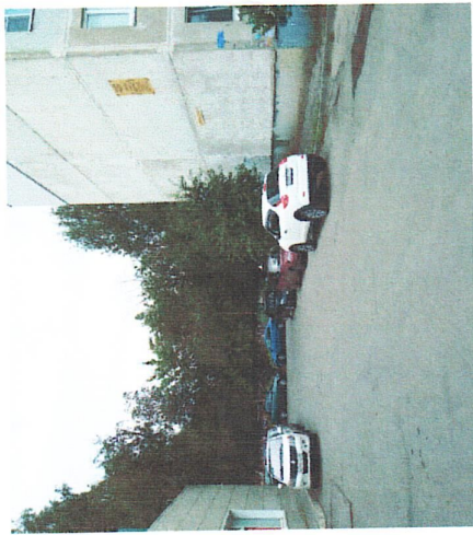
Подход к калитце с бульвара Энгунастов от магазина "Магнит"