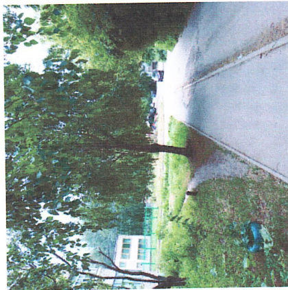
Подход и подъезд к воротам с бульвара Энгунастов от магазина "Улей"