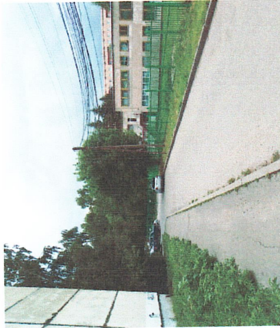
Подход и подъезд к воротам с бульвара Энгунастов от магазина "Улей"