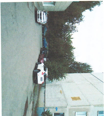
Порядок и качество с бульвара Энгельстахов от магазина "Малина"