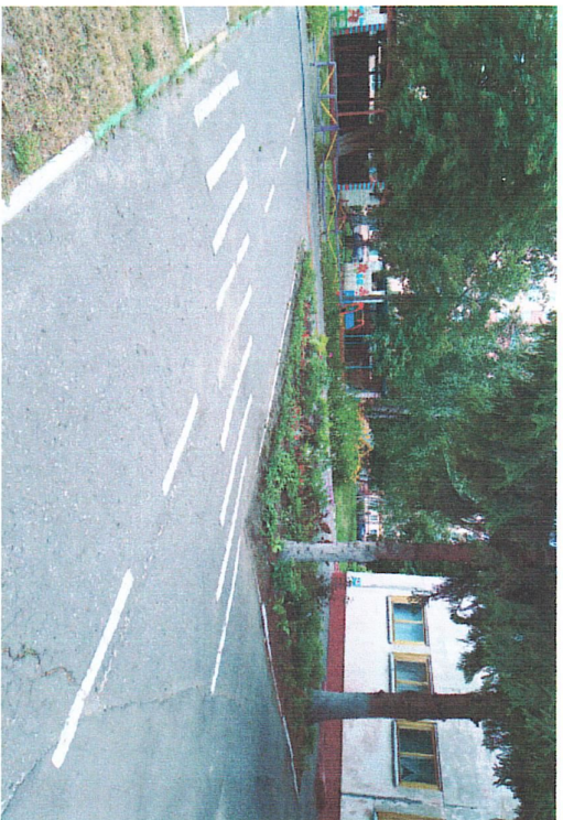
Фотоли страница: 2