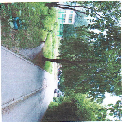
Порядок и качество к воротам с бульвара Энгельстахов от магазина "Улей"