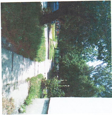
Порядок и качество с бульвара Энгельстахов от магазина "Малина"