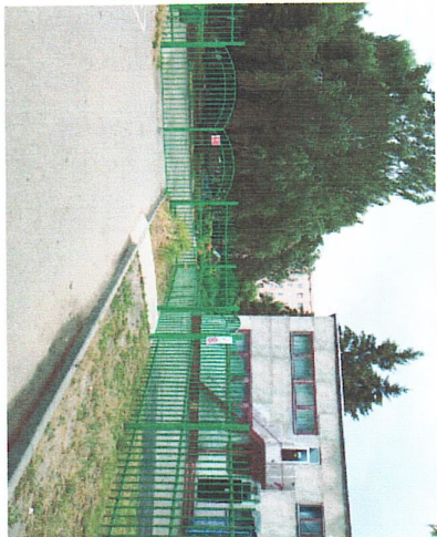
Фото на странице: 8