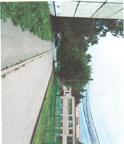
Порядок и качество к воротам с бульвара Энгельстахов от магазина "Улей"