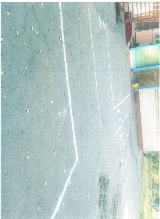
Учебно-тренировочный перекресток Березнякская на Главной